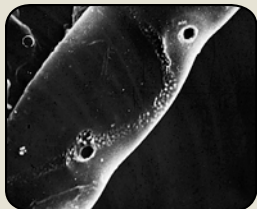
Le mycélium de RootShield a été enlevé pour montrer les dommages (trous) causés à la paroi cellulaire du Rhizoctonia

RootShield en action: cette photo agrandie montre RootShield (en haut, le plus petit mycélium) enroulé autour et attaquant le pathogène Rhizoctonia (mycélium du bas).